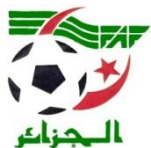
Tableau des compétitions internationales des Féminines